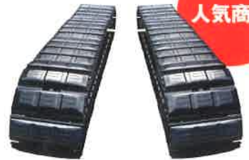
オリジナルトラックシューASSYとのセット